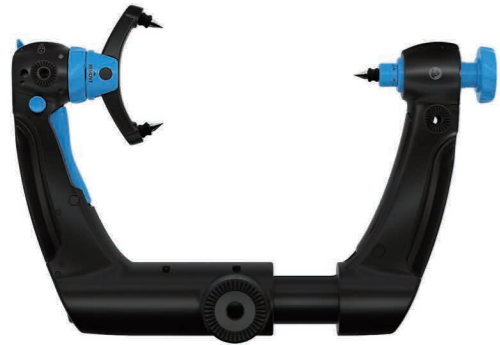
Skull Clamp Item no. 1101.001