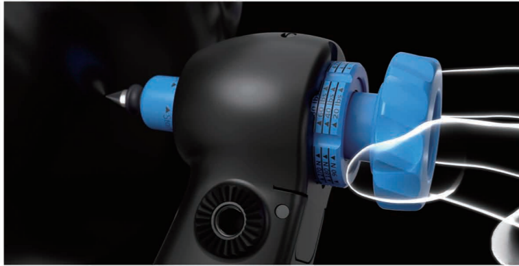
Integrated Pin Force Indication 一体型の固定圧表示