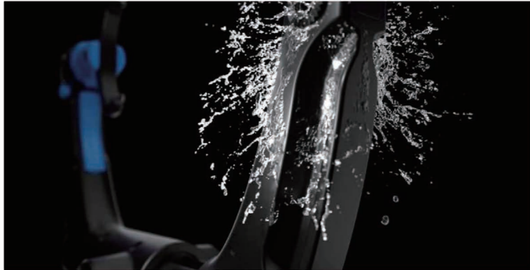
Automated Cleaning 自動洗浄