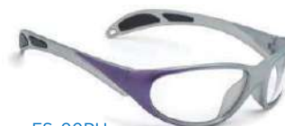
ES-99PU (パープル) ※お取り寄せ製品です。