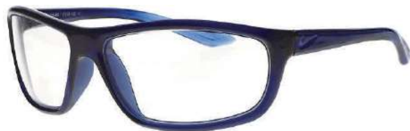
ES-NRA-410 (ミッドナイトネイビー&パシフィックブルー)