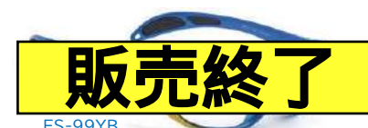
ES-99YB (イエロー/ブルー) ※お取り寄せ製品です。