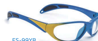
ES-99YB (イエロー/ブルー) ※お取り寄せ製品です。