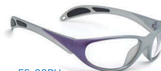
ES-99PU (パープル) ※お取り寄せ製品です。