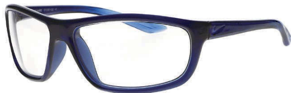
ES-NRA-410 (ミッドナイトネイビー&パシフィックブルー)