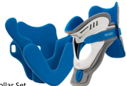
MJSR-101 Miami J ® Select Collar Set