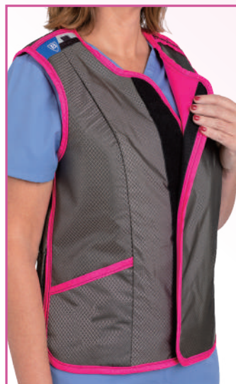
プリンセスベスト

ユニセックスベストに比べ脇の開きが少なくなり、乳がん等の原因になる脇からの被ばくから防護します。 また、重量バランスを考え、前面の余分な重なり部分を減らし、肩や腰にかかる負担を軽減しています。 ギャザーベルトにより身体にフィットする着心地を実現した女性の為のデザインです。