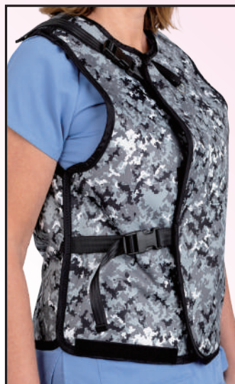
ユニセックスベスト