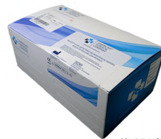
1箱 200枚入 (1袋 10枚入 × 20袋)