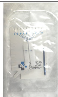
EKG 滅菌済 (1袋 10枚入)